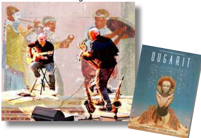
Les interventions Pédagogiques